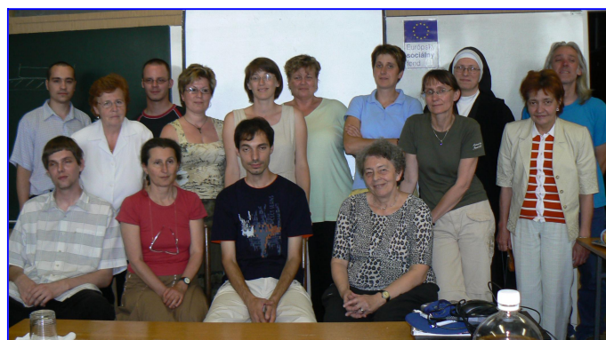
Účastníci a lektori pilotného kurzu po odovzdaní osvedčení o absolvovaní kurzu 8. júna 2007

Podporné programy projektu pre žiakov v školách účastníkov kurzu (Bratislava) ZŠ a Gymnázium Tilgnerova (tel. 65425686), Gymnázium Matky Alexie (54430785) a CZŠ Karloveská (65424043)