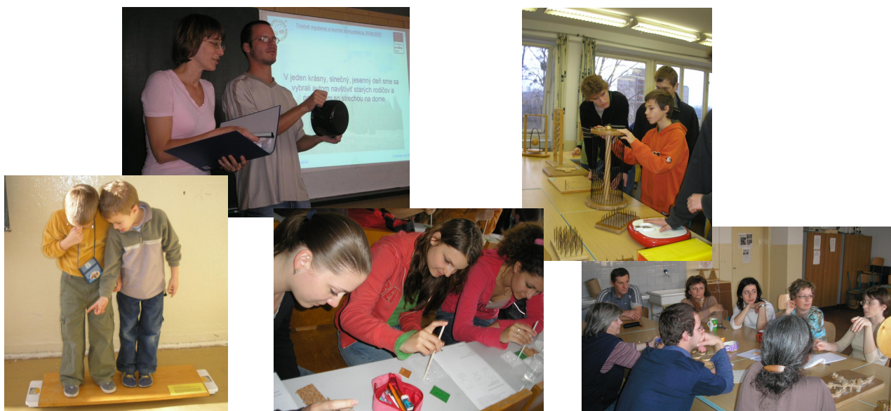
interaktívna výstava – divadielko – tvorivo-objavná dielňa – vzdelávacia hra – vyhodnotenie

Podporné programy projektu pre žiakov v školách účastníkov kurzu (Bratislava) ZŠ a Gymnázium Tilgnerova (tel. 65425686), Gymnázium Matky Alexie (54430785) a CZŠ Karloveská (65424043)